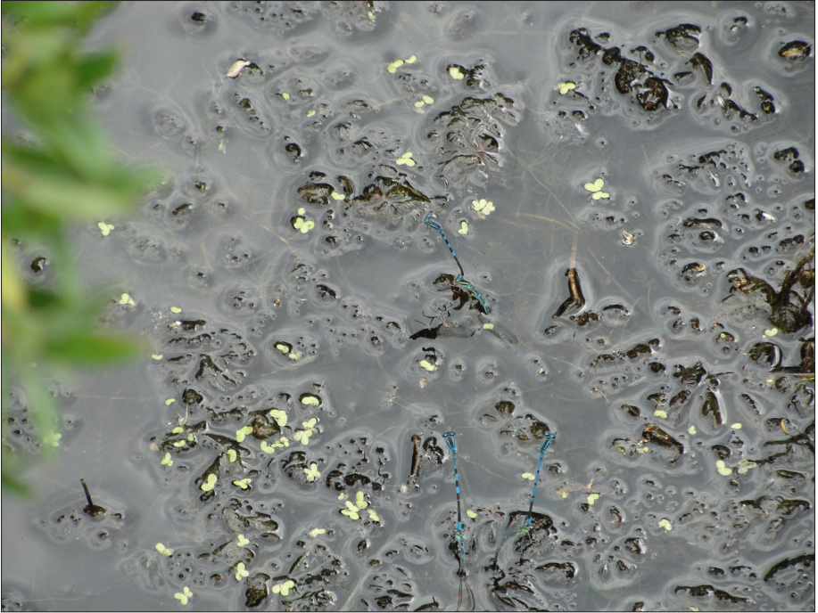
Abb. 2: Eiablage von Coenagrion scitulum (oben und unten links; man beachte die markante Schwarz-Blau-Verteilung am Abdomen der Männchen und die torpedoförmigen schwarzen Zeichnungselemente auf den Abdomina der jeweils halb untergetauchten Weibchen) und Coenagrion puella (unten rechts) am 21.06.2018 bei Heilbronn-Biberach.

Naturraums «Kraichgau». Es war individuenstark mit Fortpflanzungsaktivitäten (Abb. 2 und 3), sodass die Erstbesiedlung hier bereits 2017 oder früher erfolgt sein dürfte. Bei diesem Fortpflanzungsgewässer im Gewann Rossallmend in der Grundelbachaue handelt es sich um einen rund 150 m 2 großen Tümpel, der flächig Submersvegetation aufweist. Er wurde im Herbst 2009 als Ausgleichsmaßnahme für einen Bebauungsplan angelegt. Am 21.06.2018 flogen am Tümpel außerdem C. virgo , C. puella , E. viridulum , A. imperator , L. quadrimaculata und S. sanguineum .