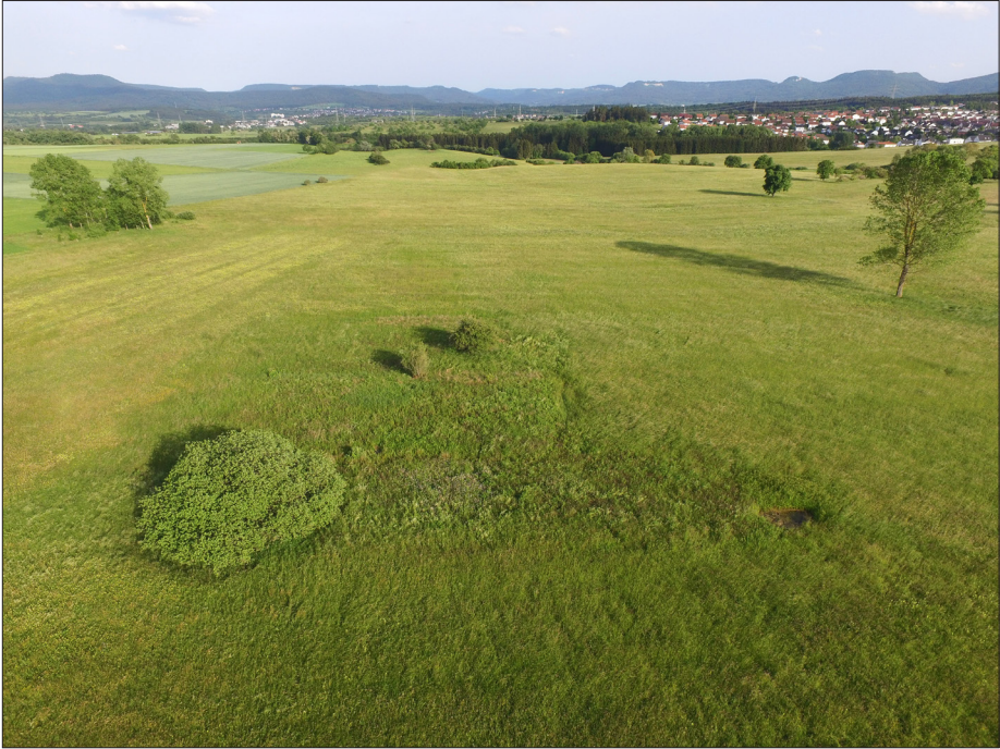
Abb. 1: Diese Nassgalle, Fundort eines Männchens von C. scitulum, wird in etwa abgegrenzt durch den kleinen Tümpel rechts vorn, das Grauweidengebüsch links vorn und die beiden Büsche im Hintergrund. Das Gebiet wird offenbar nicht (mehr) gemäht, die Vegetation besteht aus Hochstauden und Seggen ( Carex rostrata und acutiformis, Scirpus sylvestris, Iris pseudacorus, Polygonum bistorta, Geum rivale, Valeriana officinalis). An offenen Gewässern gab es am 30.05.2018 den kleinen Tümpel rechts vorne und einige auf dem Bild nicht erkennbare Kleinstgewässer mit jeweils maximal 2 bis 3 m 2 Fläche.