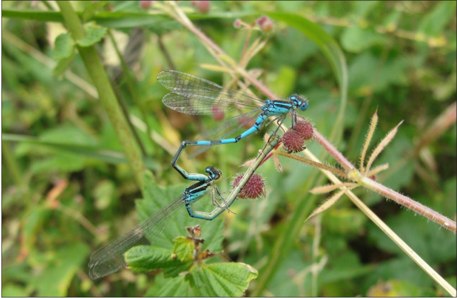
Abb. 3: Paarungsrade von Coenagrion scitulum am 21.06.2018 bei Heilbronn-Biberach. Man sieht gut die langen und hellen Pterostigmen, beim Weibchen ist auch die gelbgrünliche Unterseite gut erkennbar. Oftmals, so auch in diesem Fall bei Männchen und Weibchen, ist bei C. scitulum der Interpleuralstreifen so aufgelöst, dass er aus einem kurzen Strich und einem Punkt besteht und ein auffallendes «i» bildet.